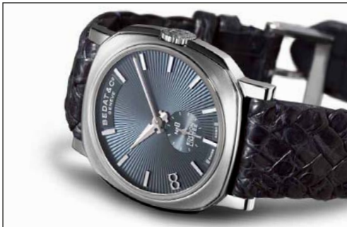
Ref 878 Limited Edition

現代的かつスポーティ。2008年に発表されたこのクロノグラフは、ベダ&カンパニーのウォッチにおけるデザインの進化を完璧に表現しています。